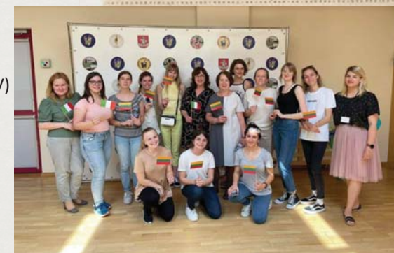
Scuola "Pilaitukas" (Vilnius).

Giugno 2022 Visita del gruppo italiano a strutture 0-6, pubbliche e private a Vilnius: - University kindergarten "Mazuju Akademija" - Public kindergarten "Viltene" - Private kindergarten "Taškis" - Voveriukai-Outdoor education - Public kindergarten "Pilaitukas"