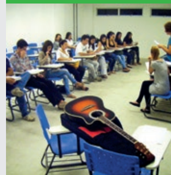
Lezione di lingua e cultura italiana alla UPE, Università del Pernambuco

→ FUNASE CASE E CASEM, PETROLINA / Servizi rivolti ad adolescenti in conflitto con la legge, con misure socio-educative in condizioni di reclusione completa o di semilibertà, previste dallo Statuto - ECA. http://www.funase.pe.gov.br/