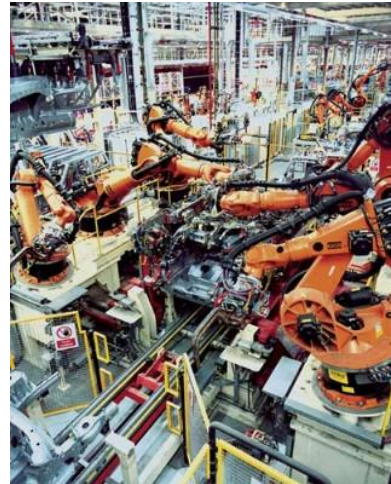
Fig. 1 – Ambiente industriale con distribuzione meccanica (a sinistra) ed elettrica (a destra) dell'energia.

Per tutte le conversioni (e applicazioni) sopra citate un ruolo importante, addirittura essenziale, è giocato dall'elettronica di potenza ormai presente nella quasi totalità di esse. I convertitori elettronici di potenza sono macchine statiche che attuano una conversione dei parametri secondo i quali l'energia elettrica si presenta (tensioni, corrente, frequenza ecc.) al fine di adeguarli al meglio alla specifica applicazione.