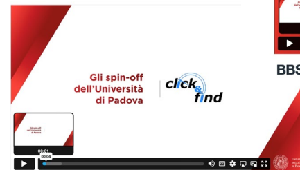
Click & Find